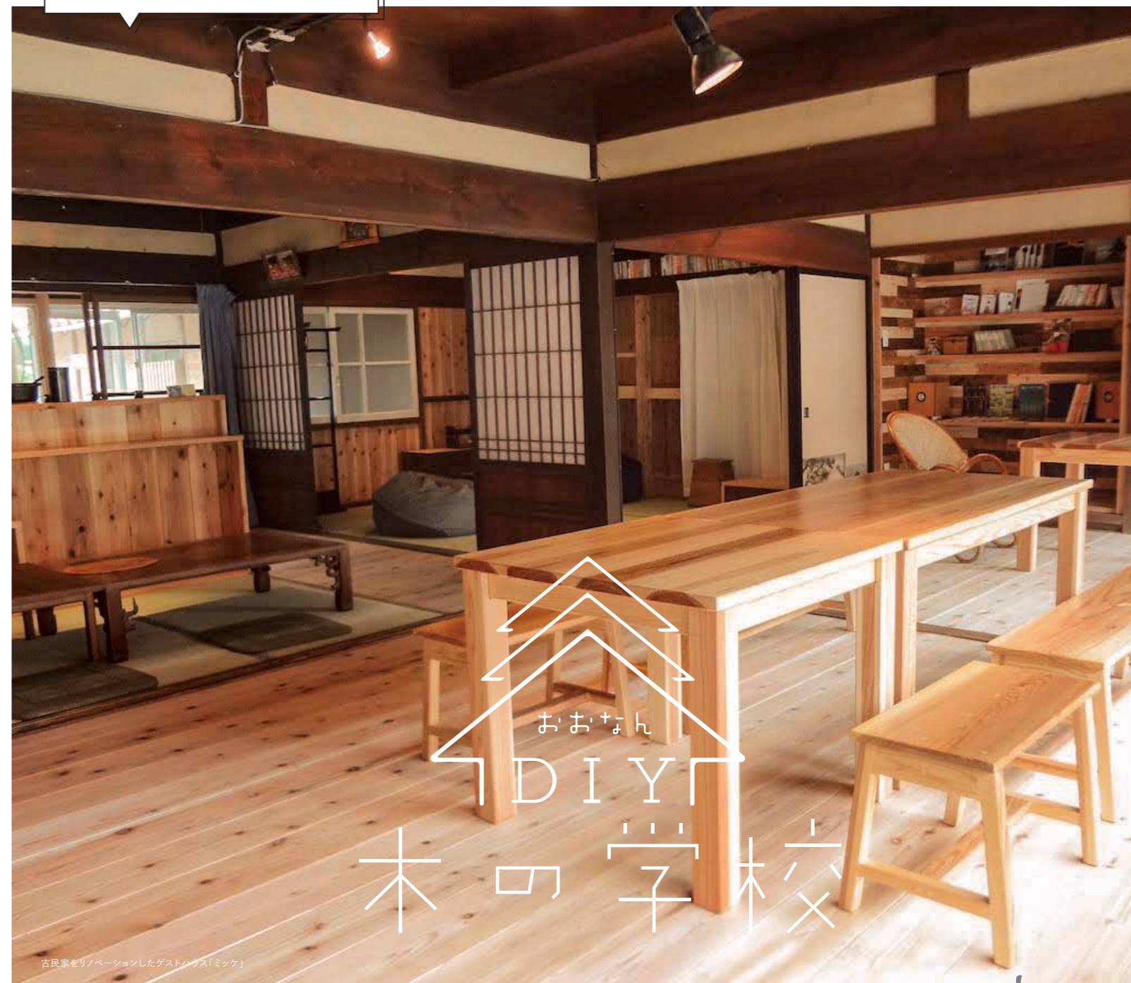
古民家をリノベーションしたゲストハウス「ミツケ」